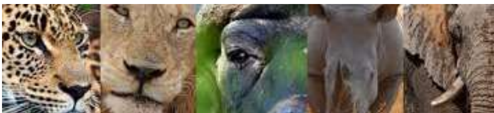
LES BIG FIVE

La Tanzanie possède plusieurs parc animaliers : Le Serengeti, le Manyara et le Cratère de l'humanité, le parc de Ngorongoro.