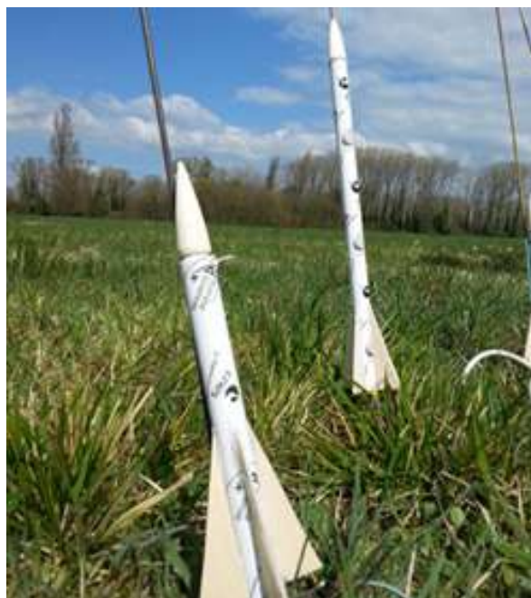
LA MICRO FUSÉE

Cette année c'est partie remise, je suis entré dans une association en étant mentoré par mon oncle. Nous sommes allés, lors d'un premier week-end effectué en octobre, à une rencontre internationale, grâce à l'association Rocketry France. Cette association a décidé de nous accueillir sur le plateau de Valensole. Un adhérent nous a proposé de confectionner une micro fusée (15cm, une fusée cheap) sur place. Je l'ai donc confectionnée durant le samedi après-midi.