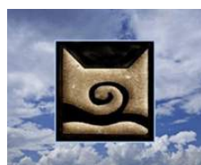
Clan du vent