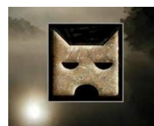
Clan de l'ombre