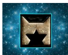
Clan des étoiles