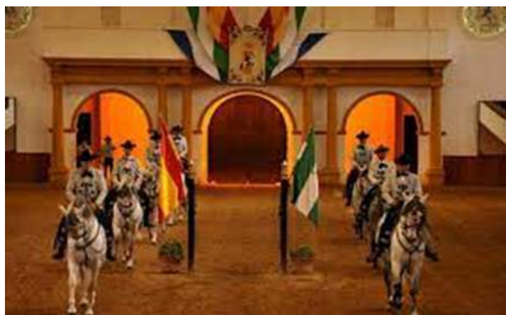
Ecole Royale Andalouse

Le Cadre Noir en tournée ! Amnéville, Clermont-Ferrand ou tout simplement au Cadre Noir, vous pouvez venir les admirer. Spectacles, saut d'obstacles, dressage... On vous en fera voir de toutes les couleurs!