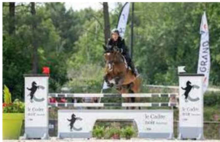
Compétition de saut d'obstacle

A la fin du XIXème le bleu passe de mode. Les cavaliers veulent donc suivre la tendance. Quand François Baucher crée le Cadre Noir, l'uniforme bleu traditionnel est remplacé par une tenue noire.