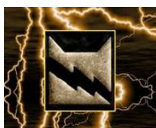
Clan du tonnerre